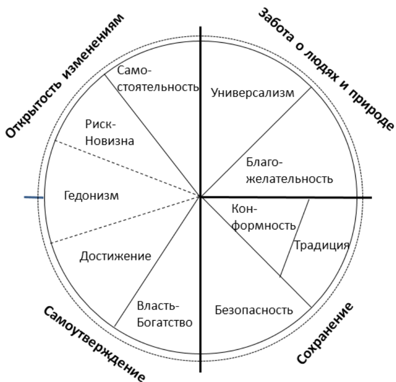
Рисунок 1. Структура ценностей по Шварцу.